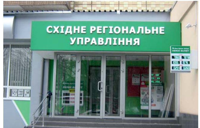
Восточное региональное управление

«В 2011 году Банк Кредит Днепр намерен расширить свое присутствие в Донецком регионе. В первом полугодии здесь планируется открытие 6-7 отделений.»